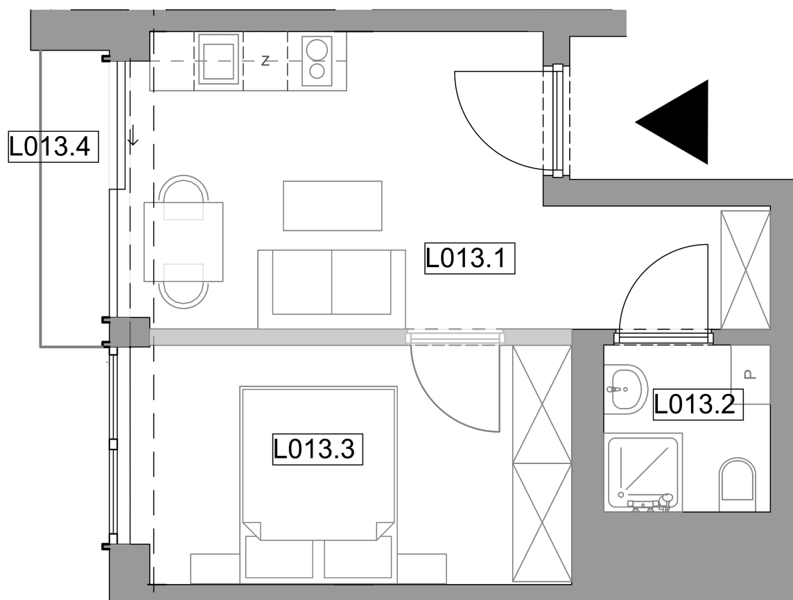
Rzut apartamentu na piętrze. BALTIC HORIZON